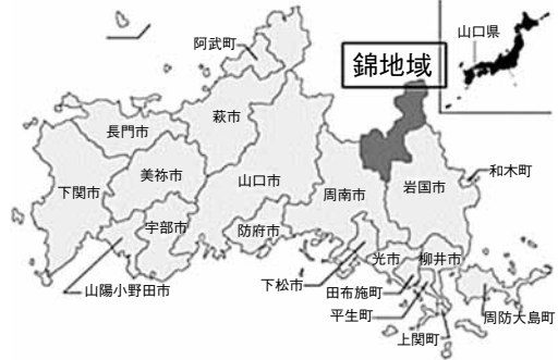
図1 山口県岩国市錦地域の位置

成され、連携・協働により、住民が安心して住み続けることができる地域づくりが目指されている。2012年から毎年、錦地域内で1カ所の地区を選び、住民調査を実施し、その結果を報告会で住民と共有して、地区課題の解決に向けて話し合うという取り組みを行っている。